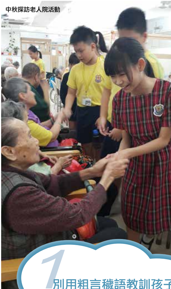
中秋探訪老人院活動

相信沒有人質疑品德教育的重要，特別在小學階段是塑造孩子具有良好品格的「黃金期」。孩子在學校學習，有老師教導良好的價值觀，但要讓孩子建立良好的品格，其實家長的身教才是最重要。